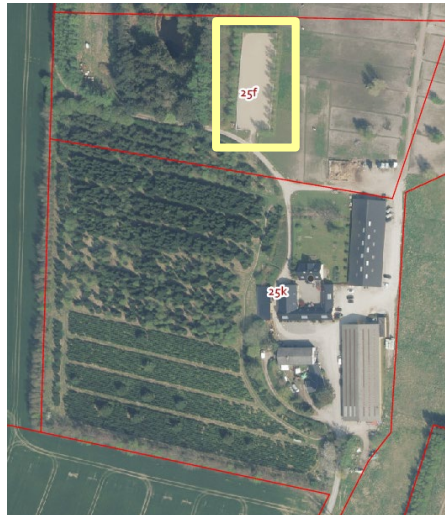
Figur 1: Satellitfoto af ejendommen fra 2024. Omhandlende ridebane er markeret med gul.

I henhold til planlovens 1 § 35, stk. 1 meddeler Forvaltningen hermed lovliggørende landzonetilladelse til en 20 x 60 meter ridebane med hegn.